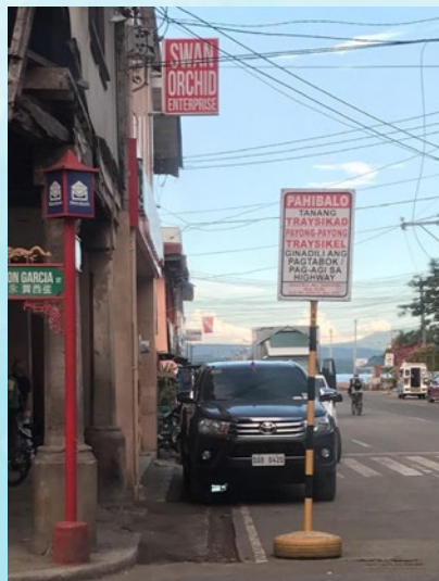
因疫情封锁，达沃市中国城的行人寥寥无几