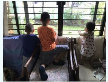
上图：三个孩子摄于新住所 下图：新家地砖爆裂，等封城结束才能修整