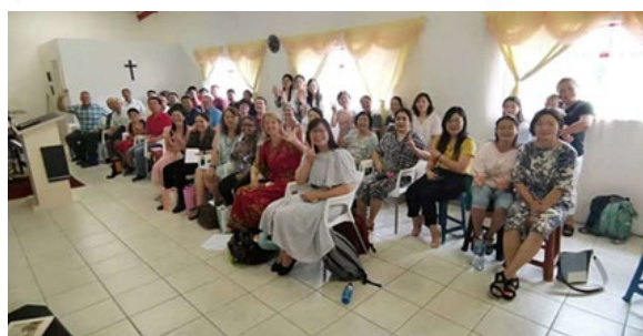
1月24日新春主日, 与南部非洲华人事工关怀网络平台中心赴史瓦帝尼行道会访宣

炎住院, 在31日送入加护病房后, 蒙主接回天家了。我们于8月2日的主日, 在线上有近百位亲友及主内肢体的缅怀与追思, 并以她之名成立宣教基金, 盼在年底解封时, 驱车一千两百公里前往开普省为她植树, 并继续她在那里的宣教心、福音情。