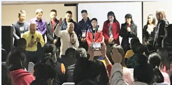
2019年6月, 在史瓦济兰的「遇见神」营会为11位洗礼者祝福

一月份, 有十四位当地白人教会青年代表们和我们前往史瓦济兰与当地华人教会欢庆新春, 与当地百姓一起欢聚! 但与此同时, 新冠疫情爆发了, 武汉首先实施封城! 南非也紧接着在3月27日与全世界“接轨”, 开始了此次全球性疫情导致的封国封城。