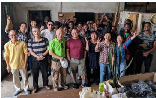
2019年5月22日，探访马普托行道会何姐妹的工厂

退休的英文 Re-tire 与更换轮胎的英文 Re-tyre 是同样的发音。代表一辆汽车原行驶于快车道，现在重新换胎换成了备胎（Spare Tyre），则应多行驶在慢车道了。所以不是退休，不是停驶，而是慢驶中！