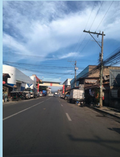
（图：依然冷清的中国城。）