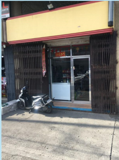
（图：笔者经常光顾的卖菜小店。）

感谢主的保守，这两年来我们的家庭敬拜、与孩子每天的基要真理和要理问答的学习一直在持续着。我们在服事别人之前，先