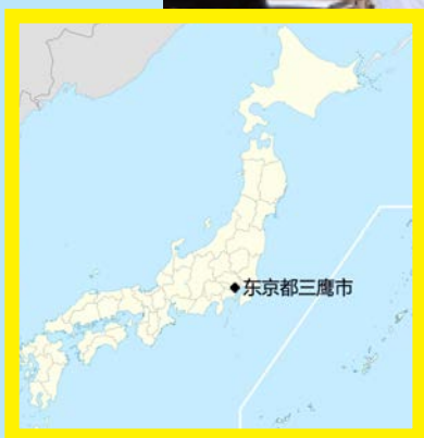
(图：三鹰市是日本东京都多摩地区最东边的城市。2021年6月1日的人口总计约有二十万人，当地华人大约有一千多人，包括海外学生和就业劳工。)