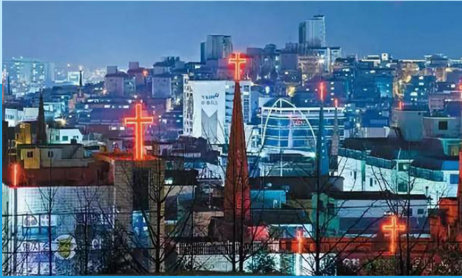
(网络图：韩国处处可见十字架。)

成长在基督新教与罗马天主教占了全国人口近三成的韩国，我记得在幼儿园时就得到一个徽章，写着“传道王”。于是从那时候起我就对传道有了负担。那年6岁。