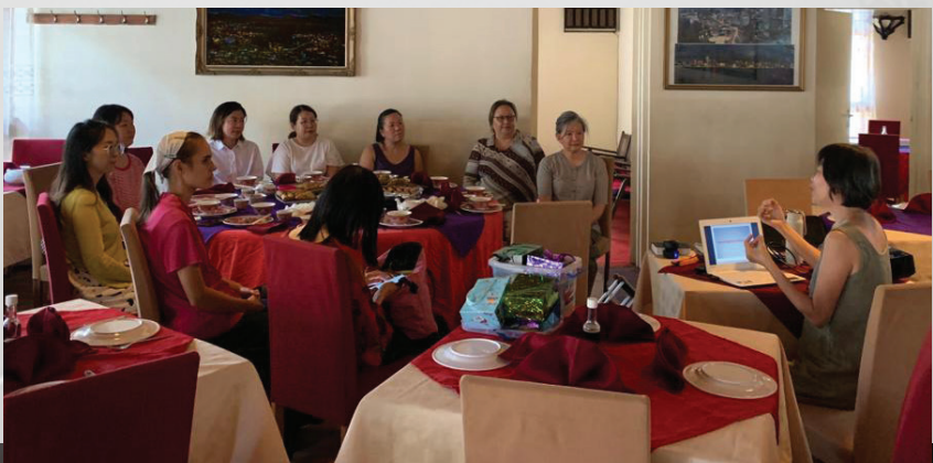
马拉维妇女节聚会

这趟非洲之旅，看到了非洲各地华人信徒的处境和需要，为了满足这些广大的需要，我们初步计划在未来能够成立“SIM海外华人全人关怀辅导事工”，连接世界各地基督徒心理咨询与治疗专业人员 and 机构，以提供海外华人教会信徒在个人身心健康、婚姻、家庭、亲子关系与青少年成长的相关课程，培训与专业服务。愿主开路，愿祂的旨意成就在地如在天，阿门！