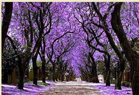
花园城市卢萨卡每年九月盛开的蓝花楸