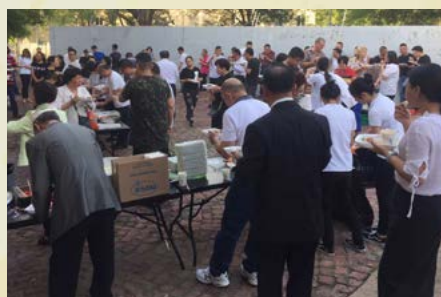
南非约堡华人卫理公会 洗礼与聚餐