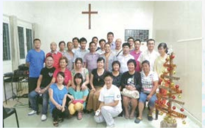
上图为马普托行道会圣诞节庆祝会后合影

马普托行道会十分感谢多年来有来自台北圣谷行道会、南非行道会和基督徒专业人士，前来马普托开办宣教特会、福音讲座、健康讲座等，让马普托的华人有更多机会听到福音。