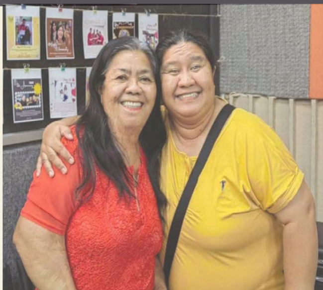
Fe 和 Mhai (菲律宾)