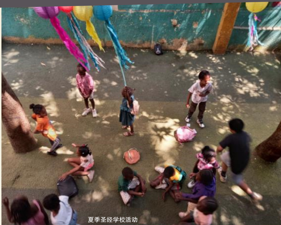
夏季圣经学校活动

一大早陪学生阅读后，我又与义工联络人开会直到下午真是又累又饿，期望着快快回家休息。在回家经过学校的路上，下午班的学生成群往学校走去。突然间，一个穿着制服的女孩跑向我并抱住我，对我微笑；我被这突如其来的举动吓着了，但疲惫感立时被一股暖流与力量取代。我认出她是几年前我陪读过的其中一位学生，现在应该读五年级或六年级了，她还记得我这位陪读姐姐。于是，我视今日的经历为主的邀约，激励我参与更多难民学校的事奉。