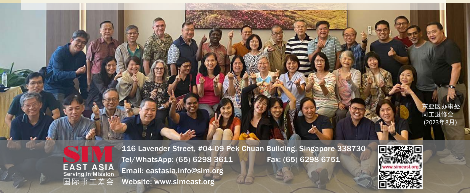
东亚区办事处 同工退修会 (2023年8月)