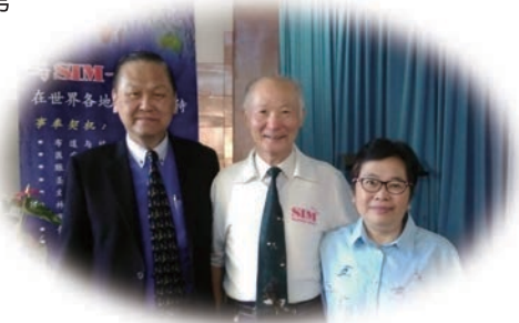
作者与段牧师夫妇摄于南非约翰尼斯堡华人行道会

扫描上网阅读杂志。 为了保护地球资源及减低印刷成本， 鼓励你发电邮通知我们 will 将纸本版改为 电子版: eastasia.info@sim.org