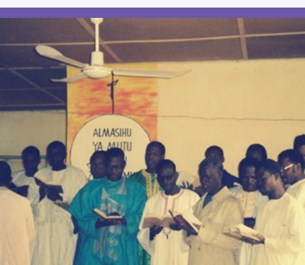
在服事期间，他们见证了乡村地区开始举行主日崇拜。