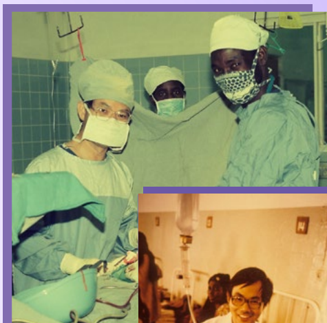
1978年8月8日：他们抵达非洲的尼日尔再飞往佳尔美，于当地佳尔美医院担任宣教医生；之后还担任西非法语系国家之医疗协调员。