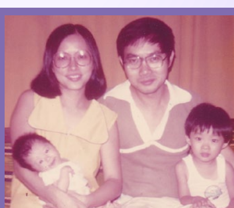
1979年4月：第二个儿子（光荣）于佳尔美医院出生。